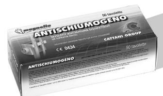
Antischiuma disinfettante Disinfecting antifoaming