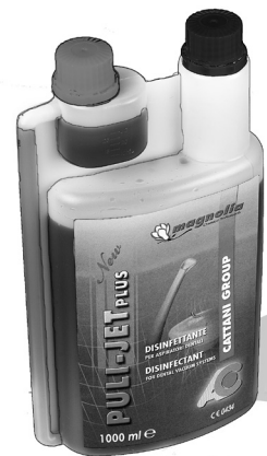
Puli-Jet plus New con anticalcare Puli-Jet plus New with anti-scaling agent